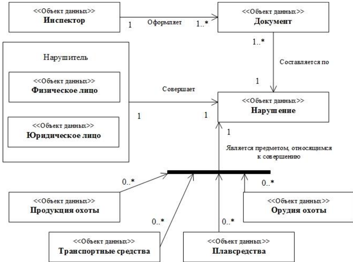
Рисунок 3-1. Описание основных объектов данных «ЭСФИОН-ОИ»

Основные объекты данных «ЭСФИОН-ОИ» приведены на Рисунке 3-1.